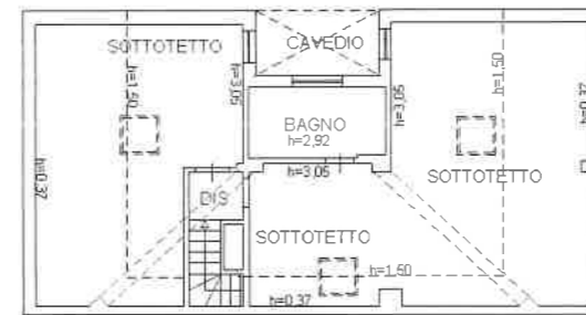
PIANO QUINTO (SOTTOTETTO)