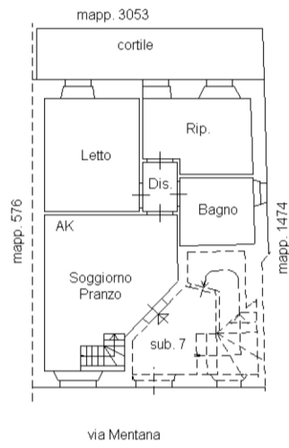
PIANO TERRA H=2.70